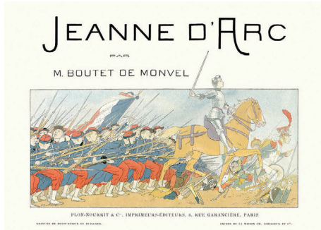
Bogen med Boutet de Monvels billeder over Jeanne d’Arcs liv, som inspirerede Johannes Jørgensen.

Måske har han alligevel lyttet til Daniel-Rops råd om ikke at træde Charles Péguy for nær og fundet sin idé overflødig, som han i øvrigt også gjorde det med et ufærdigt manuskript til en bog om helgeninden fra Lucca, Gemma Galgani, men det er en anden historie, som siden vil blive taget op her i bladet.