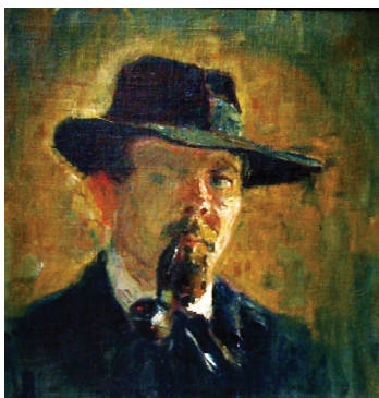
Ludvig Finds udaterede ungdoms-portræt af Johannes Jørgensen, sandsynligvis fra begyndelsen af 1890'erne. Billedet hænger i Johannes Jørgensens Hus i Svendborg udlånt af Svendborg Amts Kunstmuseum.

og fandt fodfæste i det grundtvigske miljø, hvor også hans malerkollegaer Joakim og Niels Skovgaard færdedes. En position hvor det var muligt at bevare venskaberne i begge lejre. Ballin slækkede på klosteridealet, giftede sig og genoptog kunstnerisk virksomhed og forbindelsen med Find blev genetableret. Efterhånden som Jørgensen skærpede sin polemik i tidsskriftet ”Katholiken” mod gamle venner i den radikale lejr,